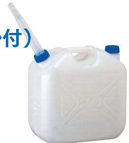
5L 水かん WTN-5