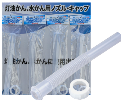
灯油かん・水かん用 ノズル・キャップ(袋入)