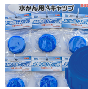
水かん用Aキャップ(袋入)