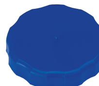
水かん用大キャップ(袋入)