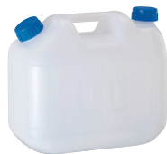
5L 水かん WT-5