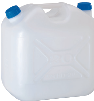
16L 水かん WT-16